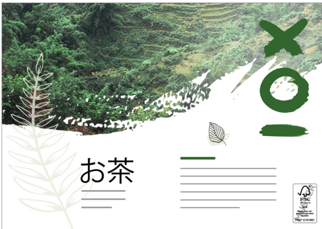
Posizionamento dell'etichetta FSC®: fronte, in basso a destra

Esempio per DIN A3 (420 x 297 mm) orizzontale